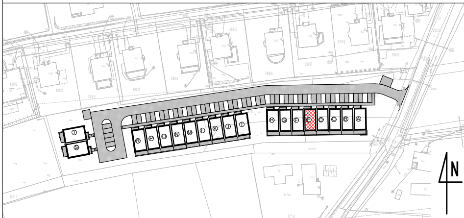
ZESTAWIENIE POWIERZCHNI POMIESZCZEŃ W BUDYNKU E LOKAL MIESZKALNY NR 1